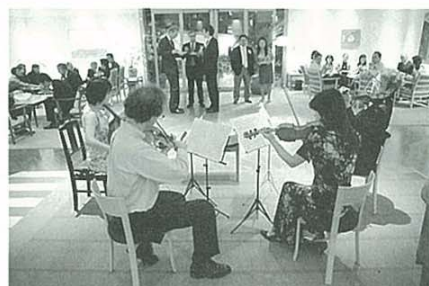
レセプション風景 (スウェーデン大使館)