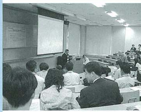
(上) APEA 2005: 2005年7月30日-31日 一橋大学マーキュリーホール 会場風景