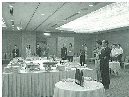
APEA コンファレンスレセプション風景

このコンファレンスの目的は、アジア太平洋諸国の研究者による貿易、国際金融、およびその関連分野の共同研究を発展させることである。これは、米国、日