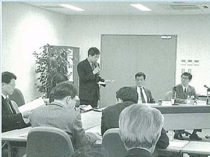
会場発表風景（東京大学経済学研究科棟）