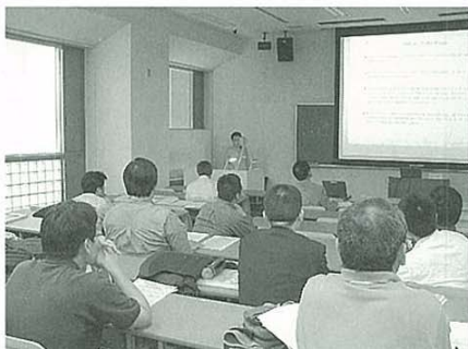
GETA 2005 発表風景

The Second General Equilibrium Theory Workshop in Asia (GETA2005)が、2005年6月25日に東京大学にて開催された。GETAは、その名のとおりの市場の一般均衡分析およびその経済問題への応用(たとえばファイナンス理論やマクロ経済動学)を主なトピックとするワークショップである。しかし、市場の一般均衡分析をより広範に捉えて、その関連分野も範囲に含めている。例えば、我々の21世紀COEプログラムの目的である「市場と非市場の連関分析」、ゲーム理論、決定理論なども重要なトピックスである。今年度は、3人の日本人と7人の外国人経済学者の発表がおこなわれた。発表者の多くは、Luo Xiao, Aditya Goenka等の国際的に活躍している経済学者であった。また発表には、不完備市場、サンスポット均衡、コア、貨幣論等の、市場のみに関わるものだけでなく、交渉ゲーム等の市場と非市場の連関に関わるものも含まれていた。