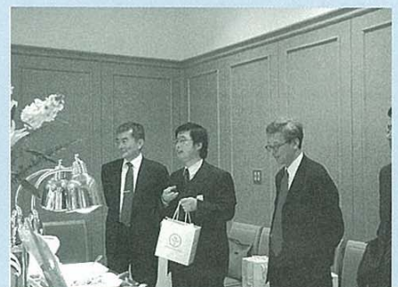
挨拶する国友センター長（中央）