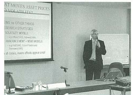
ノーベル賞受賞者のRobert Engle教授がTRIO 2005にディスカッサントとして参加、特別ランチセミナーも行った

このような問題を総合的に分析することを目的に、米国、欧州及び日本から10本の研究論文が提出され、討議を行った。