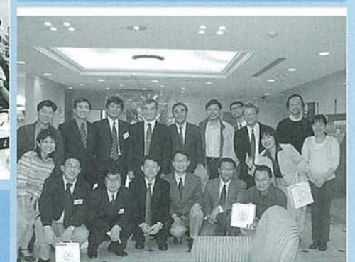
(下) ソウル大学・東京大学 “Conference on Contemporary Economic Policy Issues in Asia II” レセプションにて: ホテルフォーレスト本郷