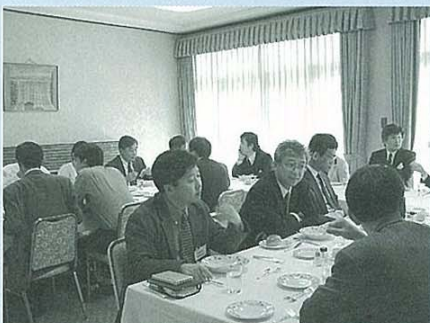
昼食・レセプション風景